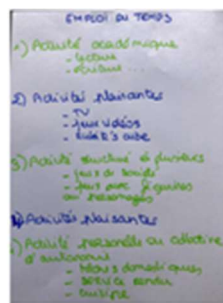
En vert : activités académiques ou nécessaires En bleu : activités plaisantes

Malgré toute l'organisation mise en place, le confinement peut générer des difficultés comportementales difficiles à gérer de par leur intensité et durée. Je n'hésite pas à demander aux professionnels qui accompagnent mon enfant au quotidien des conseils et de la guidance par téléphone ou vidéo-consultations. Je peux également consulter les liens en début de document. Pour prévenir les difficultés de comportement de mon enfant : - J'explique clairement à mon enfant ce que je veux et ce que je ne veux pas (par images/pictogrammes, mots ou en écrivant) et je peux proposer un contrat avec récompenses si j'en dispose déjà. http://ekladata.com/Skm1ynw0SLWRY2FzLOOBcVjRZZI/Systeme-d-economie-jetons.pdf - Quand je mets en place une activité, je préfère commencer avec des activités dont mon enfant est capable et qu'il apprécie, puis j'alterne avec des activités dans lesquelles il est moins à l'aise. - J'accorde à mon enfant des moments plus calmes, seul, où il peut s'auto-stimuler. - Je